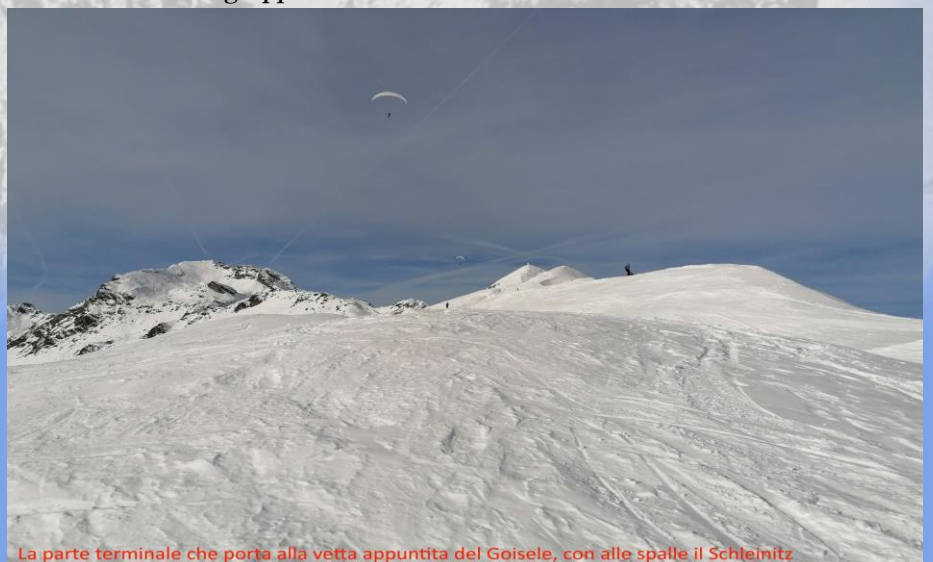
La parte terminale che porta alla vetta appuntita del Goisele, con alle spalle il Schleinitz

Si richiede puntualità e diligenza nel seguire le indicazioni dei coordinatori, rimanendo uniti in gruppo.