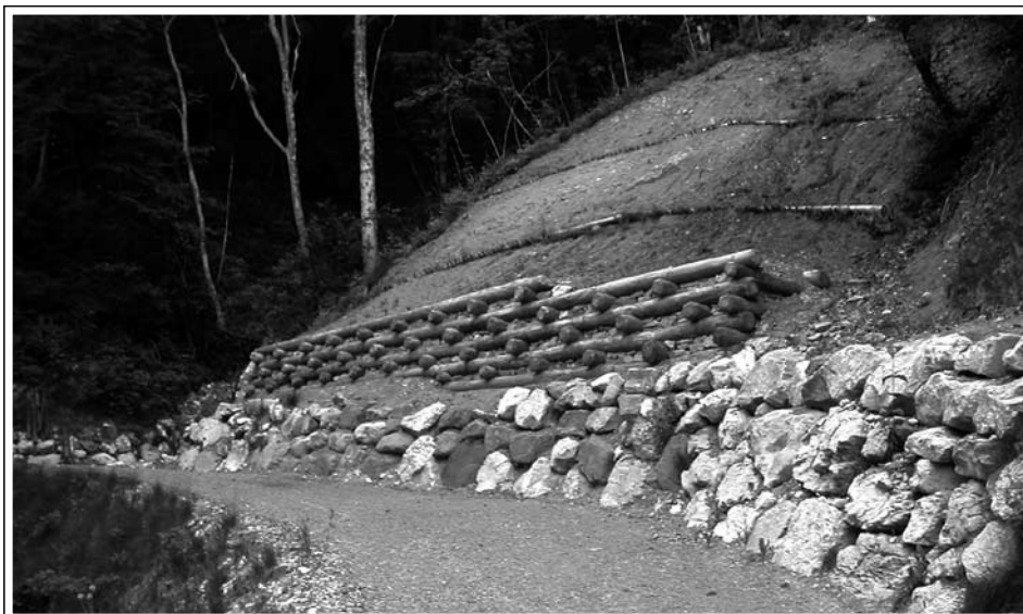
Strada con pendice in frana, sistemata mediante realizzazione di scogliera con alla sommità un'opera mista e opere a verde sulla pendice quali cordonate di talee e rinverdimenti potenziati