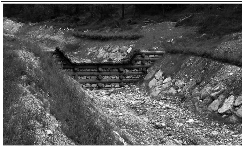
Sistemazione idraulico forestale con realizzazione di opere trasversali in legname e pietrame (briglie), opere longitudinali in scogliera e ripristino dei versanti con opere a verde quali cordonate di talee e rinverdimenti potenziati